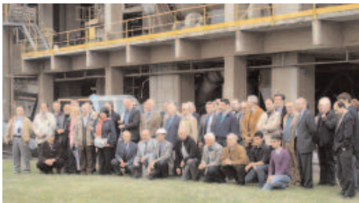
I soci Aipi davanti ai vecchi forni in ristrutturazione.

L'ing. Auxilia, direttore nuovi impianti e tecnologie del Gruppo Buzzi Unicem, ha presentato l'azienda soffermandosi sugli aspetti tecnici dei vari stabilimenti. Fondata nel 1907 dai Fratelli Buzzi, la società ha inanellato una serie di successi che hanno consentito una forte crescita produttiva e societaria. I traguardi certamente più importanti sono stati l'acquisizione di Unicem nel 1999 e nel 2001 di Dyckerhoff, primo produttore di cemento tedesco con consociate negli Usa, Europa dell'Est e Ucraina. Oggi Buzzi Unicem è presente in 11 Paesi e annovera 40 cementifici, di cui 13 in Italia.